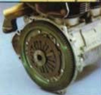
Kupplung T 160 mit Drehchwingungsdämpfer