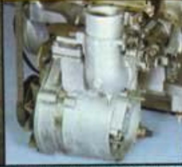
Vergaser 28 H 1-1, umweltfreundlich