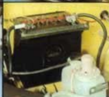
Bordspannung 12 V