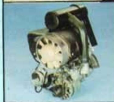
Kurbelwelle mit Kolbenringabdichtung