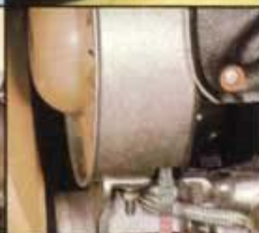
Entfall des Spannbandes und Einsatz der Zentralschraube