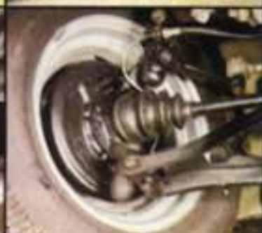
Neuer Radantrieb mit Gleichlauf- gelenkwelle