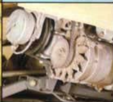
Drehstrom-Lichtmaschine 14 V/42 A mit integriertem elektronischem Regler